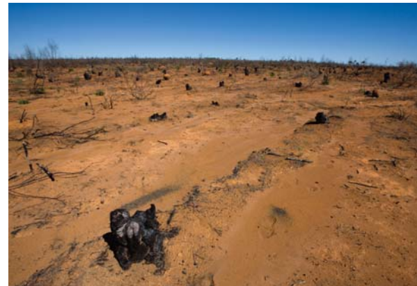
Nach der dritten Ernte ist Schluss. Zurück bleibt abgewirtschaftetes Wüstenland.