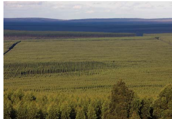
Eukalyptus wächst schnell. Mit traditionellen Sorten kann Eukalyptus nach sieben Jahren geschlagen werden, mit genmanipulierten sogar bereits nach fünf Jahren.

Durch den Eukalyptusanbau in Monokultur wurde die ursprüngliche Cerrado-Vegetation zerstört. Eukalyptus benötigt sehr viel Wasser und verdrängt alle anderen Pflanzen. Dies führte zum Absinken des Grundwasserspiegels und zu Erosion. Bei starken Regenfällen wurde die Erde