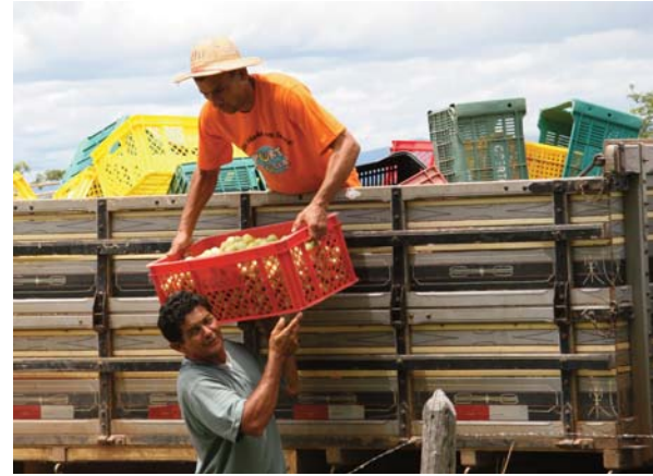
Kooperativen verfügen über ein grösseres Produktionsvolumen, was Marktvorteile bringt.

Die Geschichte von Vereda Funda zeigt nicht nur auf, wie ein ganzheitlicher Ansatz im Kleinen Grosses bewirken kann, sondern dient bereits heute als anerkannte Referenz für den ganzen Cerrado. Sie zeigt auf, wie es möglich ist, Vertreibung und Entrechtung erfolgreich entgegenzutreten und zerstörtes Land, eine Wüste, wieder fruchtbar zu machen. Das ganzheitliche HEKS-Modell zur Entwicklung ländlicher Gemeinschaften wird vom Zugang zu Ressourcen wie Land oder Wasser über Produktion, Verarbeitung bis zur Vermarktung beispielhaft umgesetzt. Aber auch der Wissenstransfer spielt eine wichtige Rolle. Die Erfahrungen von Vereda Funda sind eine wichtige Basis für Auseinandersetzungen in anderen Dörfern, in anderen Regionen. So geht das Wissen weiter zu anderen Bauernfamilien, welche ihrerseits wieder mit der Unterstützung von HEKS den Wirkungskreis der ländlichen Entwicklung in Gang setzen.