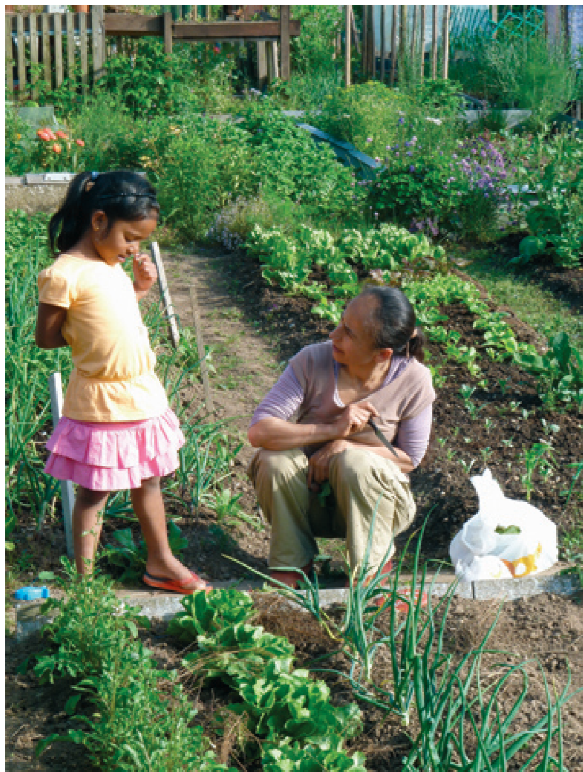
Les Nouveaux Jardins offrent aussi un espace ludique pour les enfants.